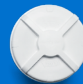
Récipient de prélèvement