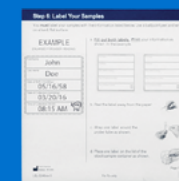
Étiquettes pour échantillon