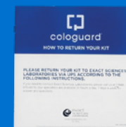
Procédure de retour de votre kit ?