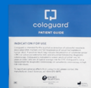
Guide du patient