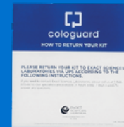
كيف تعيد مجموعة أدواتك