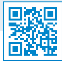
အသုံးပြုပုံ ဗီဒီယို- Cologuard.com/use

အာမခံကုမ္ပဏီအများစုသည် Cologuard စစ်ဆေးမှု ရောဂါရှာတွေ့ပြီး နောက်ဆက်တွဲ အူလမ်းကြောင်းမှန်ပြောင်းကြည့်ရှုမှုအတွက် ကျခံပေးကြသည်။ 2,3†